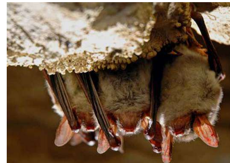
Murin de Bechstein

4 espèces sont particulièrement à enjeux en forêt de Crécy : la Barbastelle d'Europe, le Murin de Bechstein, le Murin à oreilles échancrées et le Grand Murin.