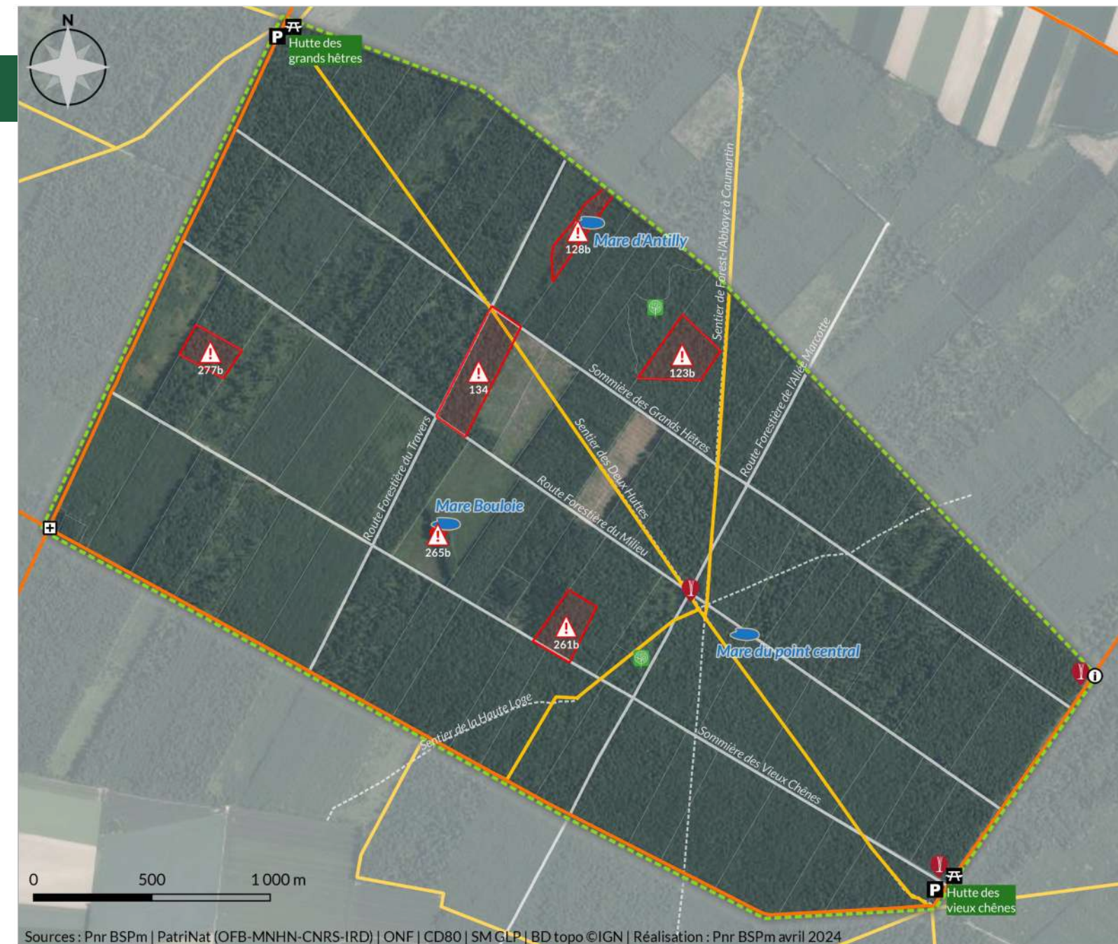
Carte des zones de sensibilité