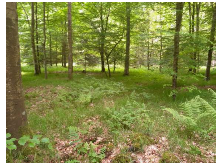
Hêtraie atlantique à Oxalide oseille.

80% du site Natura 2000 est recouvert par cet habitat.